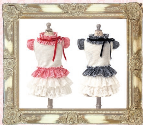
Marian (マリアン) / GLRC-67 ¥6,200 (税抜) 3S, SS, S, SM, M, L レッド、ブラック