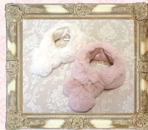
Carla(カーラ) / GLRA-A ¥2,700(税抜) S, M ホワイト、ピンク