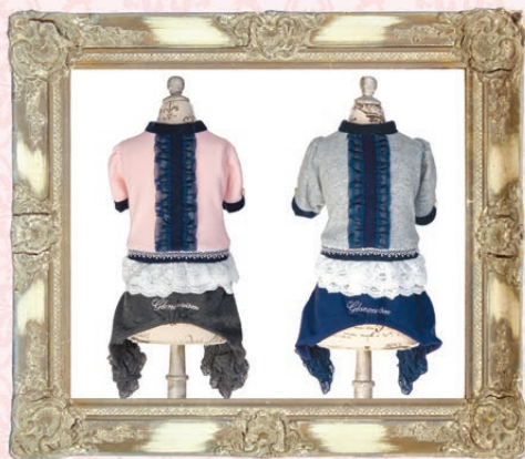
Suzzie(スージー) / GLRC-45 ¥6,700(税抜) SS, S, SM, M, L ピンク、グレー