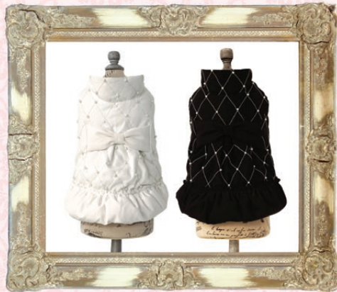
Chelsea (チェルシー) / GLRC-59 ¥9,800 (税抜) 3S, SS, S, SM, M, L ホワイト、ブラック