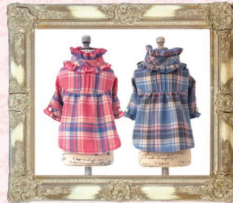
Gloria (グロリア) / GLRC-62 ¥6,400 (税抜) 3S, SS, S, SM, M, L ピンク、ブルー