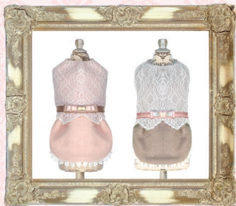
Shayla(シェイラ) / GLRC-42 ¥7,800(税抜) SS, S, SM, M, L ピンク、モカブラウン