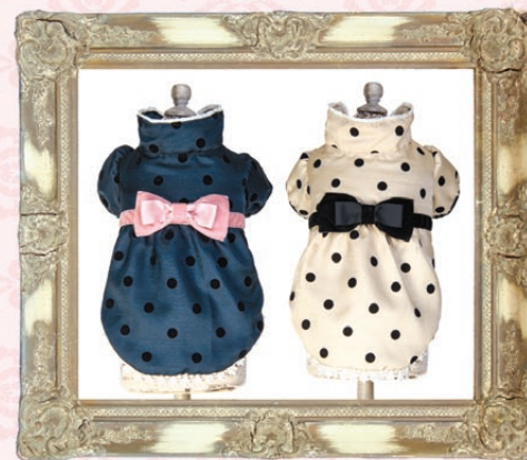
Felicia(フェリシア) / GLRC-46 ¥9,200(税抜) SS, S, SM, M, L ネイビー、ベージュ