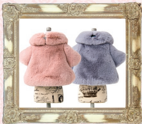
Eva (エヴァ) / GLRC-65 ¥9,600 (税抜) SS, S, SM, M, L ピンク、グレー