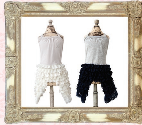
Outlast Noah (ノア) / GLRC-60 ¥6,800 (税抜) SS, S, SM, M, L ホワイト、ネイビー