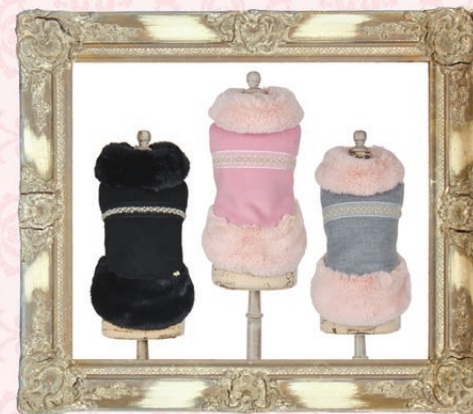
Angela (アンジェラ) / GLRC-40 ¥9,800 (税抜) SS, S, SM, M, L ブラック、ピンク、グレー