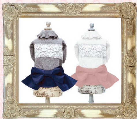
Rosa (ローザ) / GLRC-66 ¥8,500 (税抜) 3S, SS, S, SM, M, L グレー、ホワイト