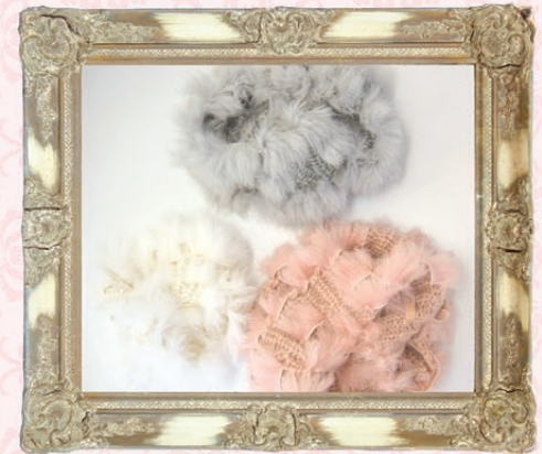
Liz (リズ) / GLRC-63 ¥3,800 (税抜) S, M ホワイト、グレー、ピンク