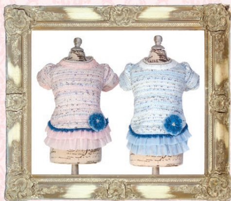
Elina(エリナ) / GLRC-44 ¥7,200(税抜) SS, S, SM, M, L ピンク、ブルー