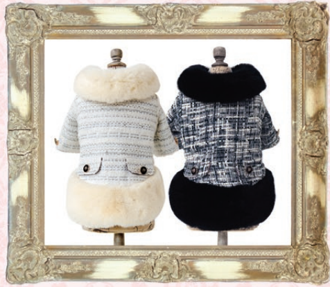
Victoria (ヴィクトリア) / GLRC-56 ¥9,800 (税抜) 3S, SS, S, SM, M, L ホワイト、ブラック