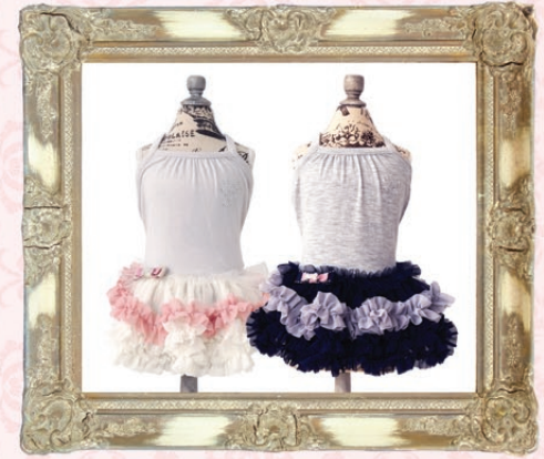
Outlast Celia (セリア) / GLRC-61 ¥6,300 (税抜) 3S, SS, S, SM, M, L ホワイト、ネイビー