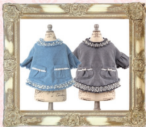
Amanda (アマンダ) / GLRC-64 ¥7,900 (税抜) 3S, SS, S, SM, M, L デニム、グレー