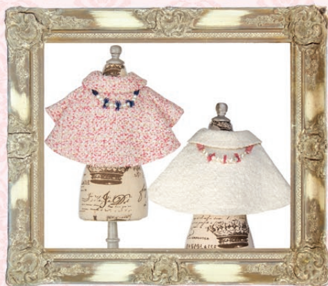
Fran(フラン) / GLRC-43 ¥8,800(税抜) 3S, SS, S, SM, M, L ピンク、ホワイト