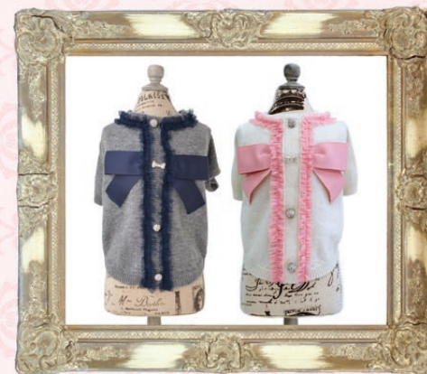
Carlie (カーリー) / GLRC-69 ¥8,500 (税抜) 3S, SS, S, SM, M, L グレー、ホワイト