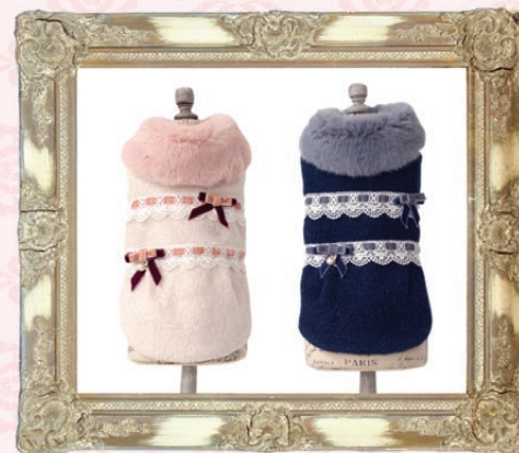
Mona (モナ) / GLRC-68 ¥8,700 (税抜) 3S, SS, S, SM, M, L ピンク、ネイビー