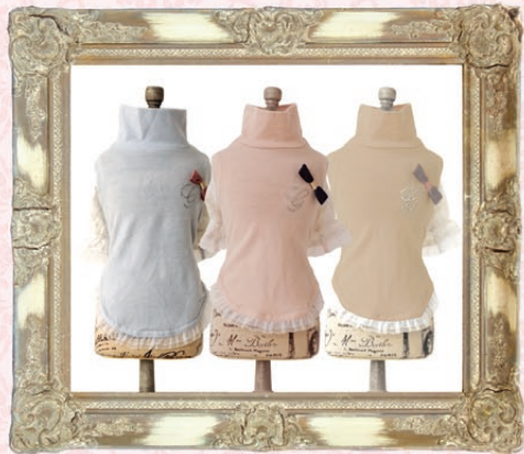
Betty (ベティ) / GLRC-58 ¥4,800 (税抜) 3S, SS, S, SM, M, L ブルー、ピンク、ベージュ