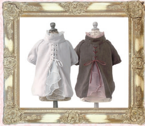
Gina (ジーナ) / GLRC-57 ¥7,800 (税抜) 3S, SS, S, SM, M, L アイスグレー、ブラウン